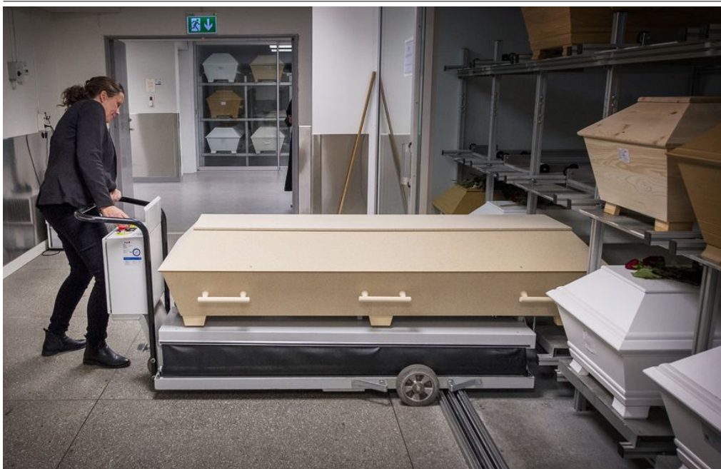
Malin Hilgendorf önskar att fler pratade om döden och om hur man vill ha sin begravning.