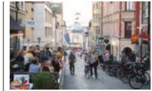
Gå en stadsvandring och upptäck Stockholm på nytt.