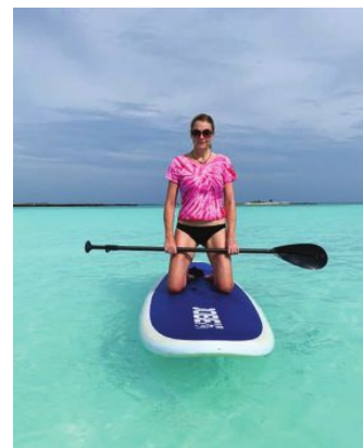
Merparten av de aktiviteter som erbjuds handlar om närbkontakt med vatten – på, i eller under.