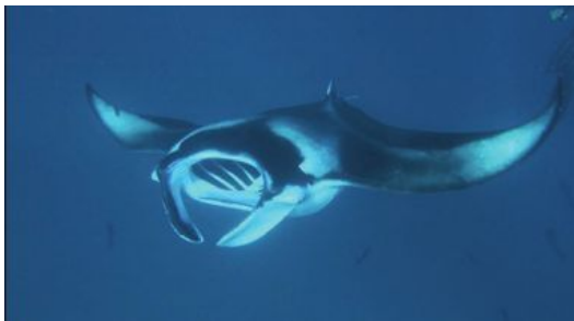
Att se mantor under en snorklingsutflykt till Hanifaru Bay blir en av höjdpunkterna på resan.