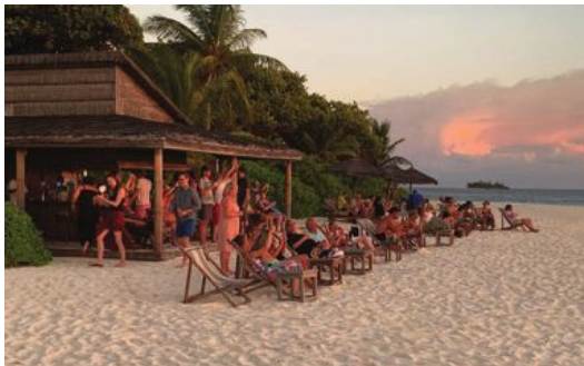
Solnedgången klockan sju är en av dagens höjdpunkter. Ingen är dock den andra lik, så man vill inte gärna missa någon.