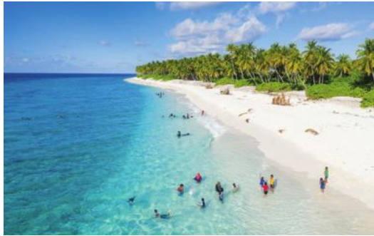
På de lokala öarna finns större möjlighet att möta lokalbefolkningen och ta del av den inhemska kulturen. Bilden är från Haa Alif atoll.