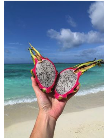
Fruktstund! Färsk frukt finns i överflöd, en del odlas i resorternas trädgårdar.