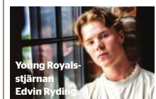
Young Royals-stjärnan Edvin Ryding

Skådespelaren Edvin Ryding i tidningen Café, apropå att han vann en resa till den klassiska filmfestivalen när han tilldelades Zaldano Rising Star Award på Stockholm Filmfestival. (TT)