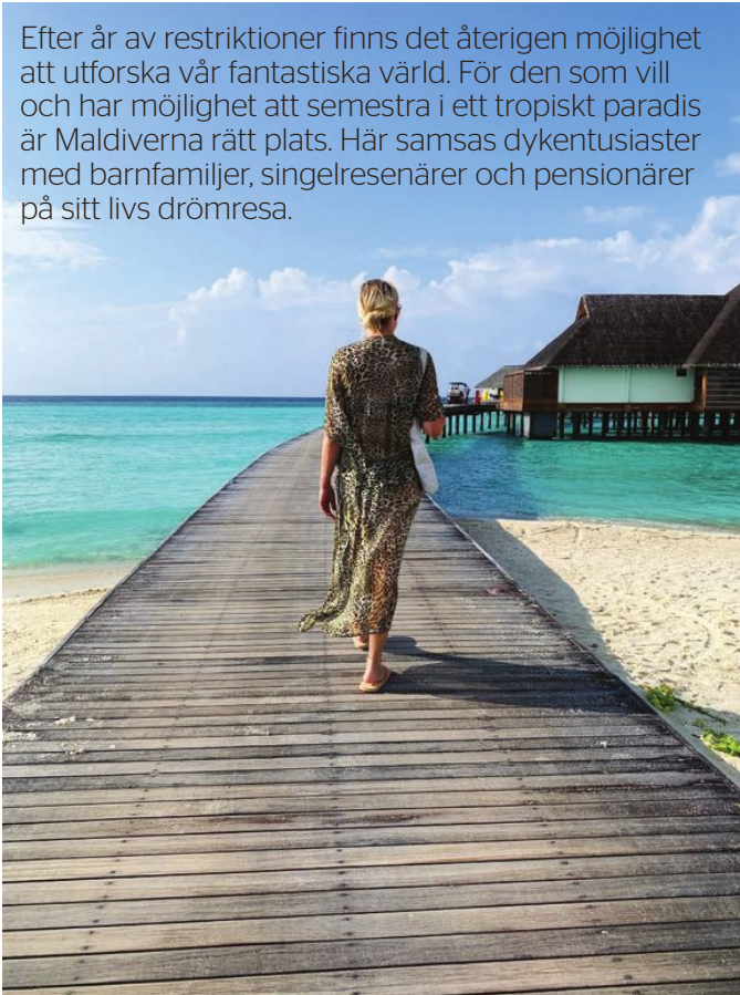
Trots att resorten vi bor på är nästan fullbelagd finns det gott om utrymme. Man har ofta känslan av att befinna sig helt själv på en exotisk plats, utan vare sig andra turister eller personal.

Efter år av restriktioner finns det återigen möjlighet att utforska vår fantastiska värld. För den som vill och har möjlighet att semestra i ett tropiskt paradiset är Maldiverna rätt plats. Här samsas dykentusiaster med barnfamiljer, singelresenärer och pensionärer på sitt livs drömmesa.