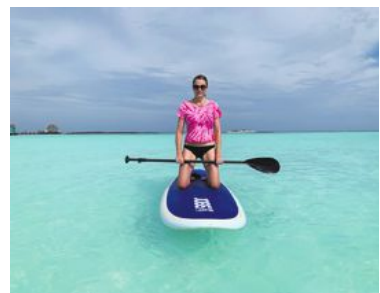
Merparten av de aktiviteter som erbjuds handlar om närbild med vatten – på, i eller under.