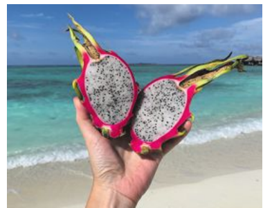
Fruktstund! Färsk frukt finns i överflöd, en del odlas i resorternas trädgårdar.