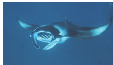
Att se mantor under en snorklingsutflykt till Hanifaru Bay är en av höjdpunkterna.