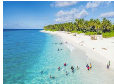
På de lokala öarna, som här i Haa Alif atoll, finns större möjlighet att möta lokal kultur.