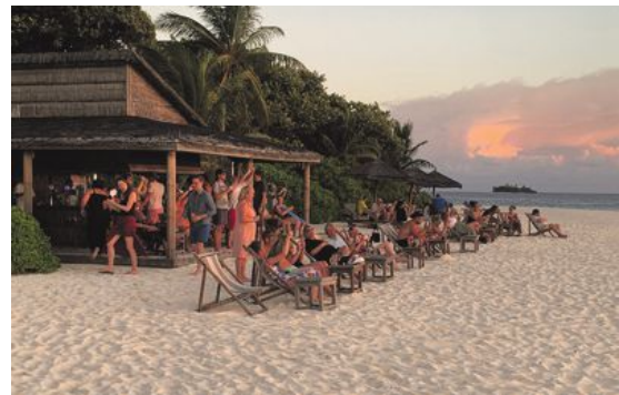
Solnedgången klockan sju är en av dagens höjdpunkter. Ingen är dock den andra lik, så man vill inte gärna missa någon.

● Budget: Aveyla Manta Village. På ön Dharavandhoo finns flera pensionat med enklare rum till budgetpris. Pensionatet Aveyla Manta Village ligger precis vid turiststranden. Hit kan du komma från Malé med både inrikesflyg (cirka 20 minuter) eller med färja (cirka 2 timmar). (TT)