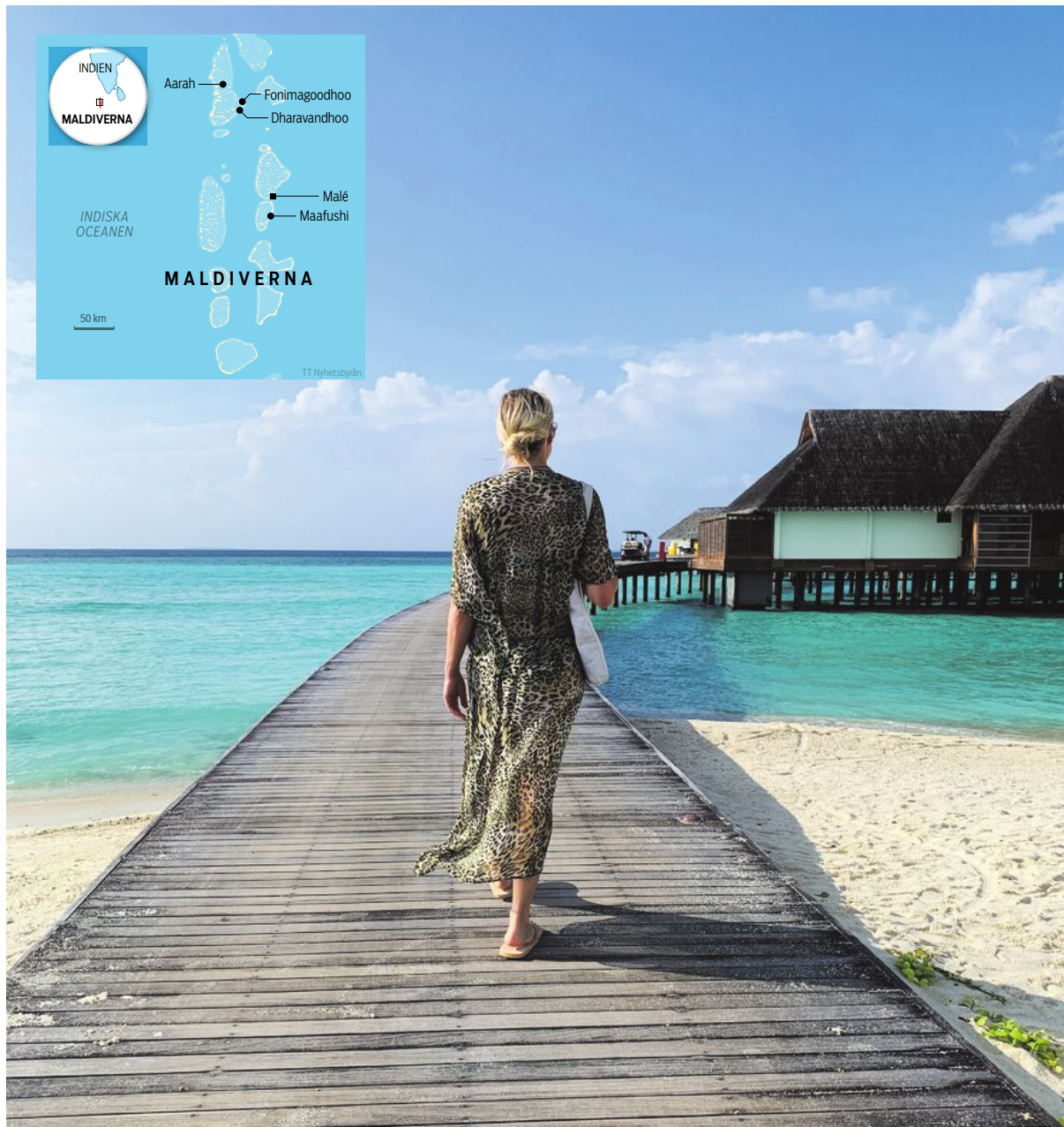
Trots att resorten vi bor på är nästan fullbelagd finns det gott om utrymme. Man har ofta känslan av att befinna sig helt själv.