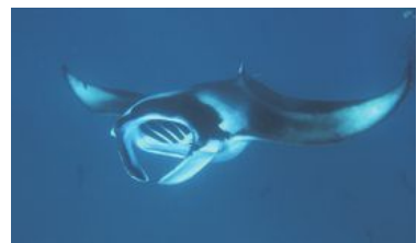
Att se mantor under en snorklingsutflykt till Hanifaru Bay är en av höjdpunkterna.