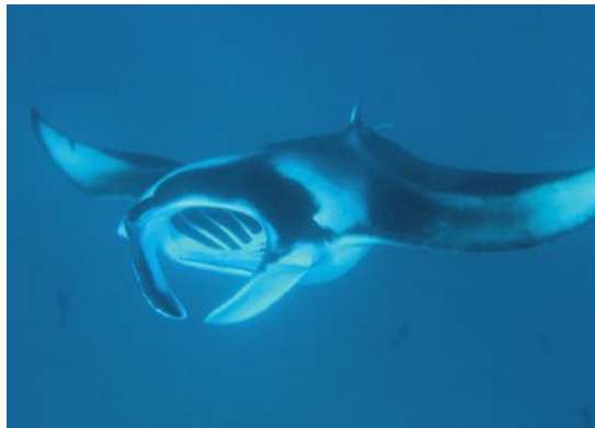
Att se mantor under en snorklingsutflykt till Hanifaru Bay blir en av höjdpunkterna på resan.