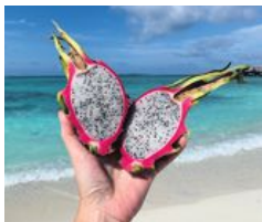
Fruktstund! Färsk frukt finns i överflöd, en del odlas i resorternas trädgårdar.

Det går inte att förbereda sina sinnen för Maldiverna. Färgerna kastar emot oss: smaragdgröna trädkronor ovanför en kritvit sandstrand och de genomskinliga turkosa vågorna som guppar mot stranden. Sandstigarna som genomkorsar ön är ströslade med nyfallna blommor i rosa och orange, som vore ön platsen för ett tropiskt bröllop som aldrig tar slut. När vi väl har plockat upp hakan från bryggans plankor blir vi skjutsade till vår vattenvilla. Det är oneligen ett enkelt liv här.