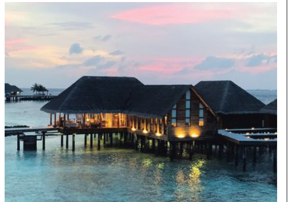
På Heritage Aarah erbjuder spaet sköna behandlingar när solen lysar med sin frånvaro. MALIN HEFVELIN