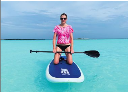
Merparten av de aktiviteter som erbjuds handlar om närlinjekontakt med vatten – på, i eller under.