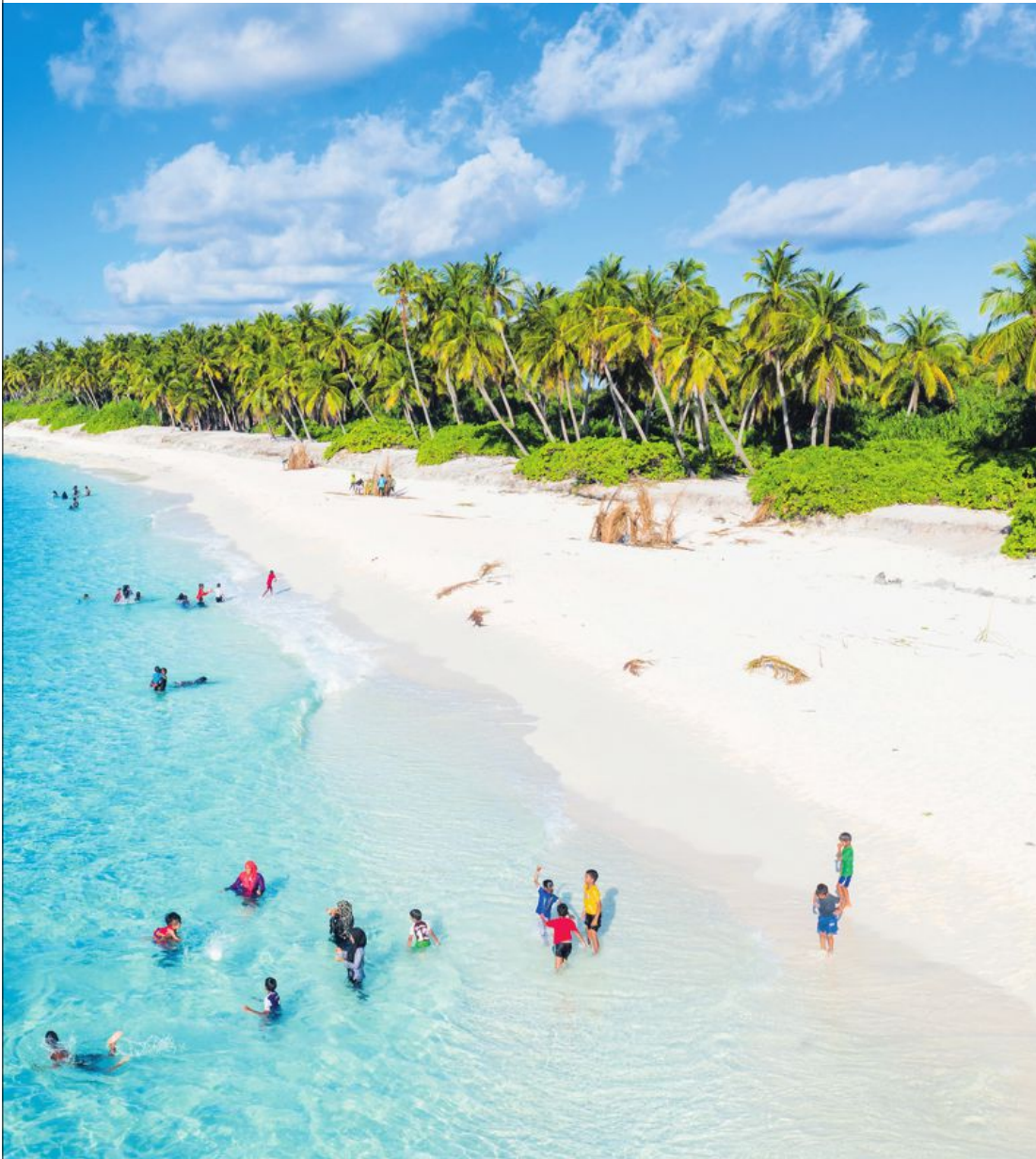
På de lokala öarna finns större möjlighet att möta lokalbefolkningen och ta del av den inhemska kulturen. Bilden är från Haa Alif atoll.