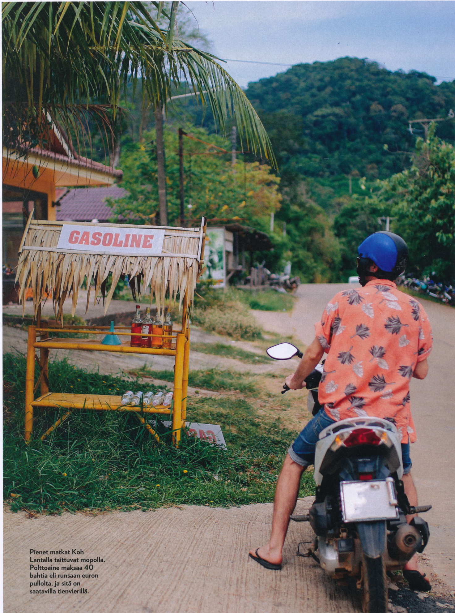
Pienet matkat Koh Lantalla taittavat mopolla. Polttoaine maksaa 40 bahtia eli runsaan euron pullolta, ja sitä on saatavilla tienvierillä.